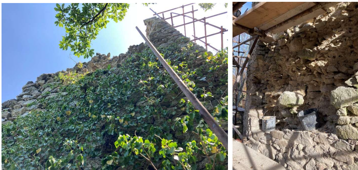
Obr. Sanačný zásah M1/2022: Exteriérová strana. Vľavo pôvodný stav západného líca. Vpravo oprava veľkej kaverny, ktorá bola ukrytá pod brečtanom