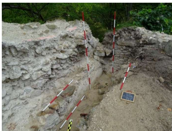
Obr. A3/2022 interiér: V miestnostiach pod úrovňou terénu sa našli časti pôvodných omietok