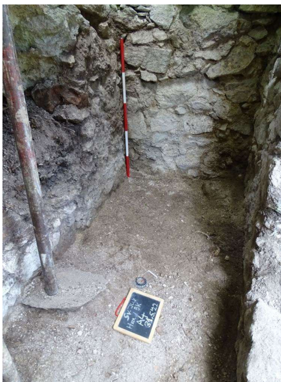
Obr. Sonda A4/2022: Interiér a exteriér šachty v severnom úseku východnej hradby