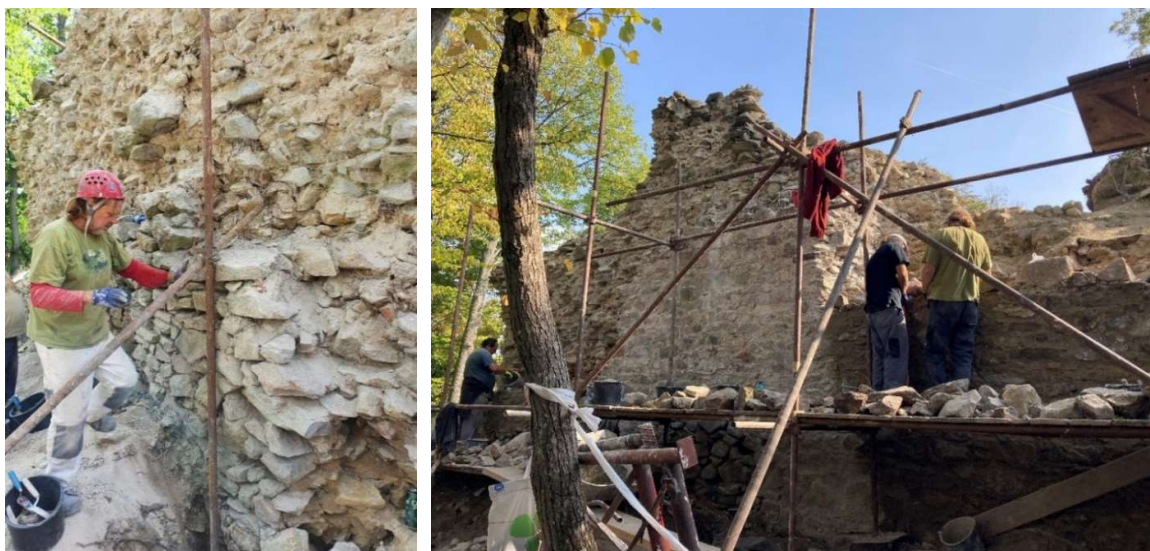
Obr. M3/2022: Domurovali sa rozsiahle plášťové odtrhy a výpadky muriva