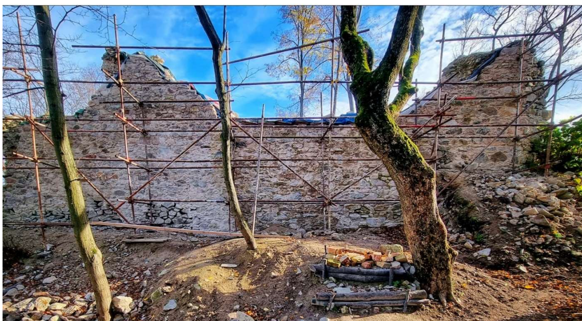
Obr. Sanačný zásah M3/2022: Porovnanie stavu západného múra paláca pred a po zásahu