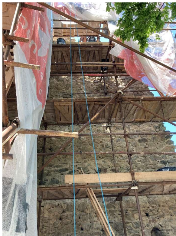
Obr. Sanačný zásah M1/2022: Oprava obrannej veže – interiérová strana