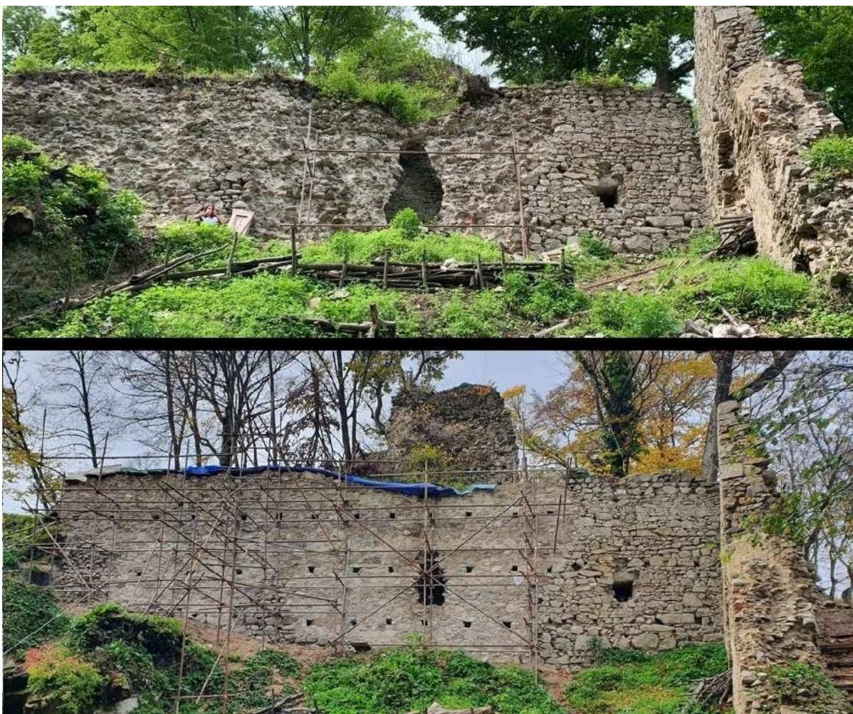
Obr. Sanačný zásah M5/2022: Porovnanie stavu úseku východnej hradby pred a po zásahu