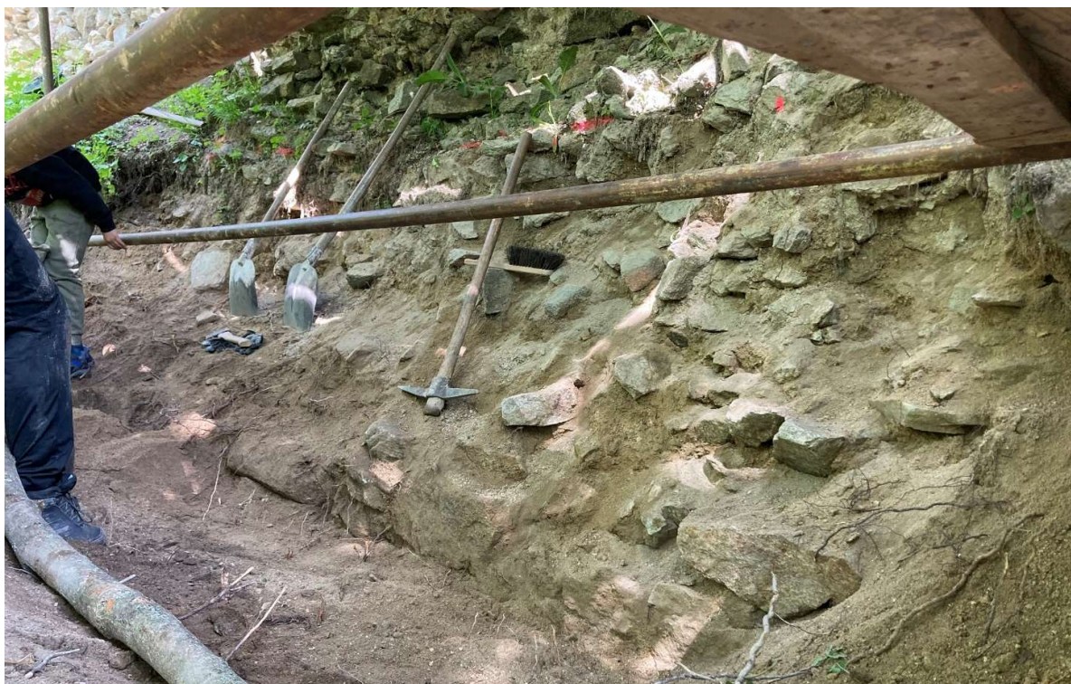
Obr. Sonda A5/2022: Priebeh výkopových prác