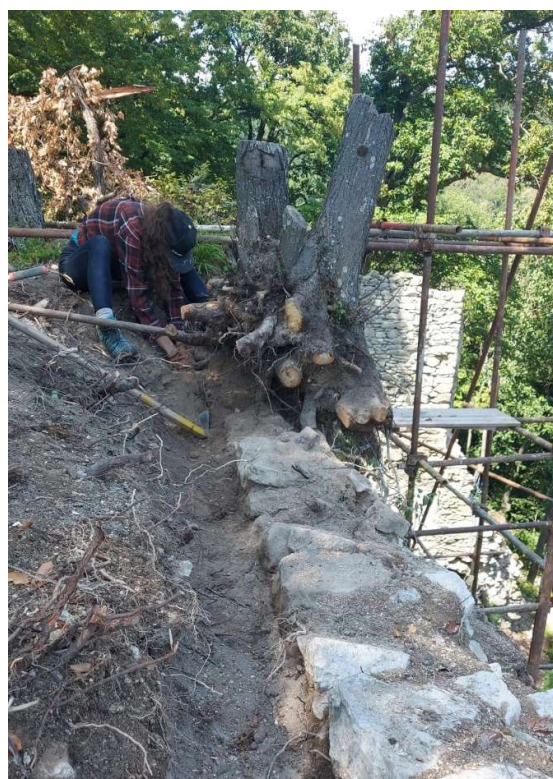
Obr. Sanačný zásah M5/2022: Vľavo: Domurovávanie rozsiahlych plášťových odtrhov Vpravo: Odstraňovanie mohutných stromov vrastených do koruny hradby