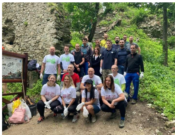
Obr. Účastníci celoslovenského dobrovoľníckeho podujatia Naše Mesto (jún 2022)