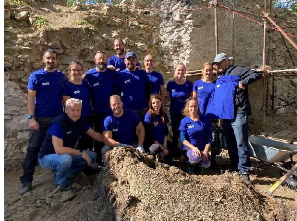
Obr. Účastníci celoslovenského dobrovoľníckeho podujatia Naše Mesto (jún 2022) a Týždeň dobrovoľníctva (september 2022).

Na Bielom Kameni sme v r. 2022 privítali aj študentov, zapojených do brigád v rámci celosvetového programu osobnostného rozvoja mladých Cena vojvodu z Edinburgu (DofE). V rámci kampane "Zapojenie 3 generácií do obnovy Bieleho Kameňa" spolupracujeme s 96. Malokarpatským zborom slovenských skautov a s niekoľkými školami bratislavského kraja.