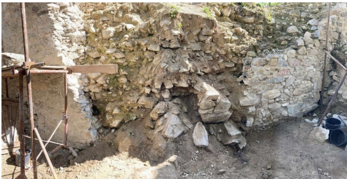
Obr. M3/2022 Stav západného múru po úplnom odstránení suťového kužela

Objem murovania zásahu M3/2022 výrazne prevýšil plánovaný objem a vznikli práce navyše z dvoch dôvodov: (1) dovtedy neznáma skutočná hrúbka múru paláca dosahuje až 220 cm, (2) stav múru po odkopaní sute bol oveľa horší, ako sa predpokladalo.