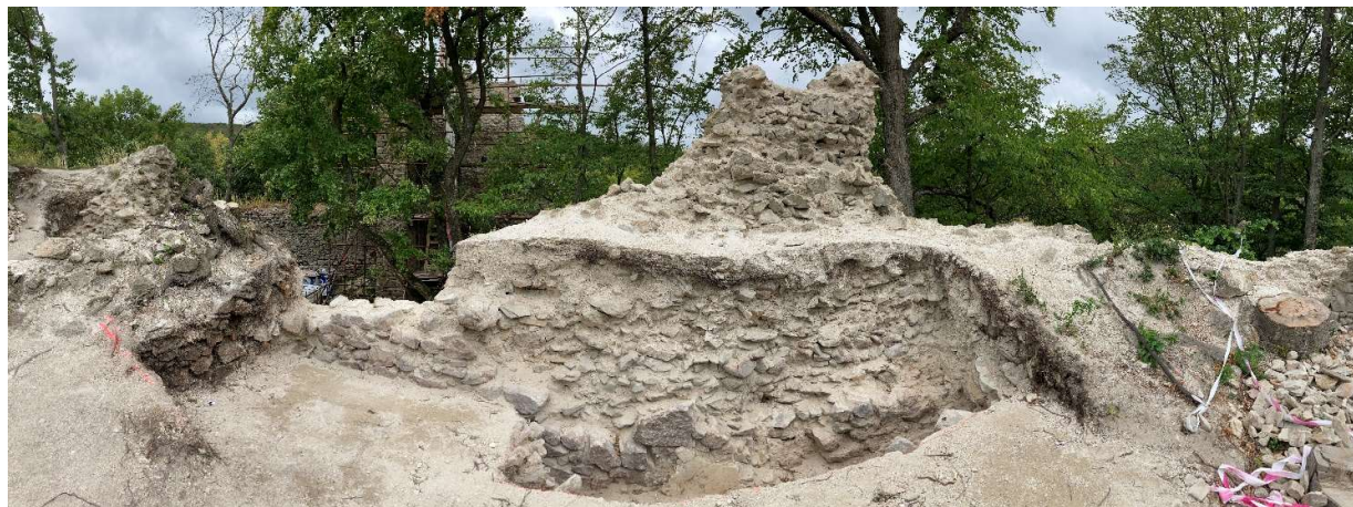
Obr. A3/2022: Odľahčením z interiérovej strany sa predišlo zrúteniu vychýleného pahýľa

Po konzultácii so statikom sa navyiac zrealizovali aj ďalšie sondy v interiérovej oblasti západného múru horného hradu. Po odkopaní závalu z vonkajšej strany totiž vyvstala potreba z bezpečnostných dôvodov znížiť tlak odľahčením objemu sušovej hmoty, ktorý vytlačal murivo pahýľov zo strany interiéru smerom von. Objem archeologických prác A3/2022 tak značne narástol. Z toho dôvodu nebolo možné dokončiť sondu A5/2022 v celom plánovanom rozsahu.