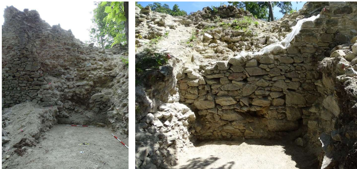
Obr. A3/2022: obnažené pôvodné murivo exteriéru západnej steny paláca

konzervačným zásahom M3. Archeologické etapy bolo nevyhnutné postupne striedať s murárskou konzerváciou častí pahýľov.